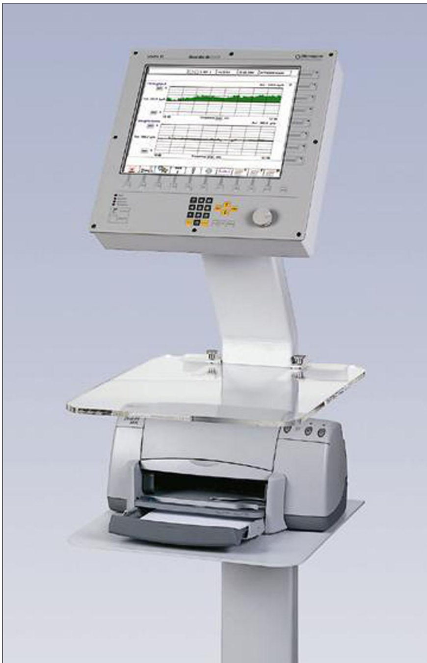
Visualização VisEx C acoplado num rack conectado a uma impressora jato de tinta

Isto permite ao sistema ser expandido com outros módulos de medição e controle Octagon em estágios posteriores.